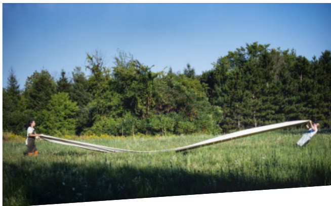
Exposition Petit guide pratique pour un banquet imaginaire - Chapitre 3 de Tanha Gomes et Sandrine Côté

› Productions Marianne Trudel | Organisme