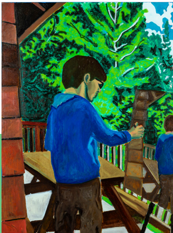
Œuvre de Sam Kasirer-Smibert, un artiste soutenu par le CAM

De 2022 à 2025, le soutien aux groupes prioritaires est passé de 20 % à 26 %, dépassant la cible de 25 %. Cette progression reflète l'effort conjoint du Conseil et des milieux artistiques pour renforcer la représentativité et l'équité au sein du secteur.