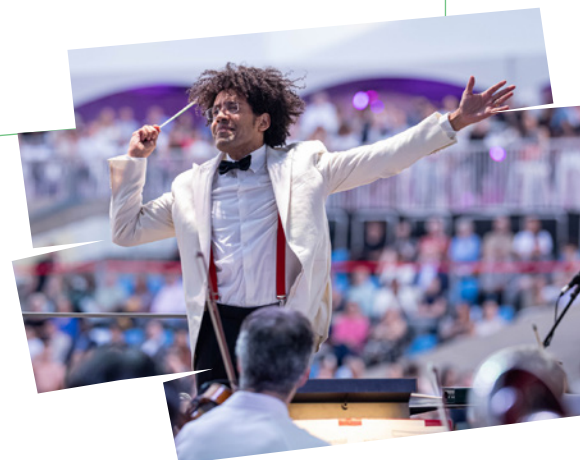
Le chef de l'OSM, Rafael Payare, lors d'un concert présenté au Parc Olympique