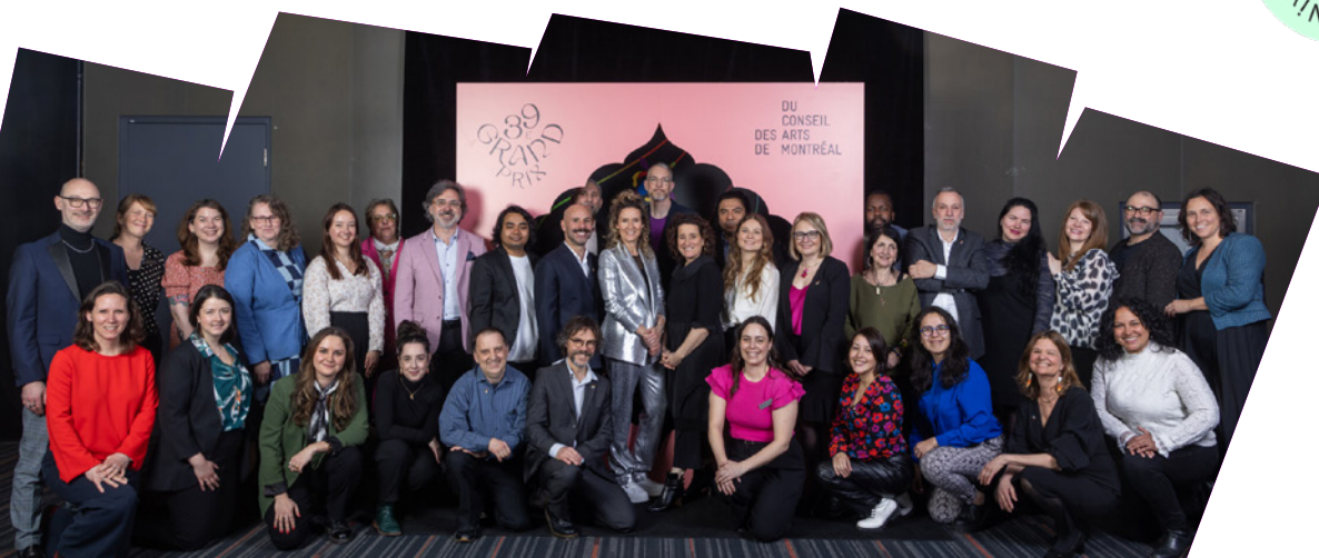
L'équipe du Conseil lors du 39 e Grand Prix