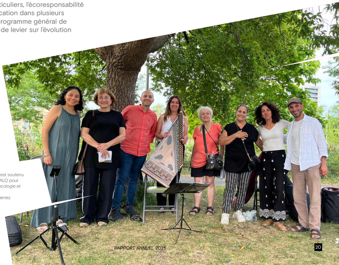
Ensemble Caprice est soutenu par le CAM et le CALQ pour ses projets alliant écologie et diversité culturelle.

L'écoresponsabilité constituait l'un des nouveaux axes du plan stratégique 2022-2025, traduisant la volonté d'arrimer le soutien public aux arts aux enjeux environnementaux et sociaux contemporains. En visant l'intégration des critères écoresponsables dans 100 % des programmes pertinents, la cible a été atteinte.