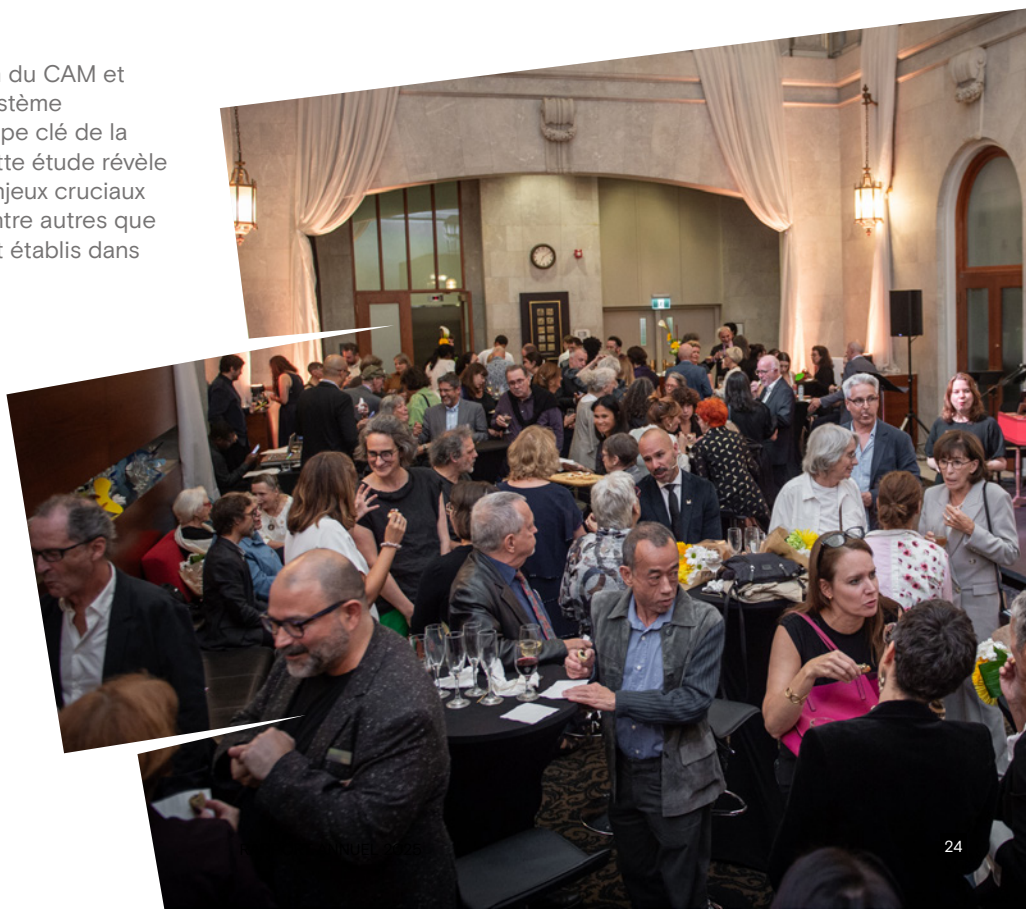
Première soirée Consécration

Derrière chaque artiste et organisme artistique se trouvent des professionnel·le·s dont l'engagement a façonné la vitalité artistique de Montréal. Dans une démarche de mémoire et de reconnaissance, le CAM exprime sa gratitude envers ces personnes qui ont laissé une empreinte durable sur le visage culturel de la métropole.