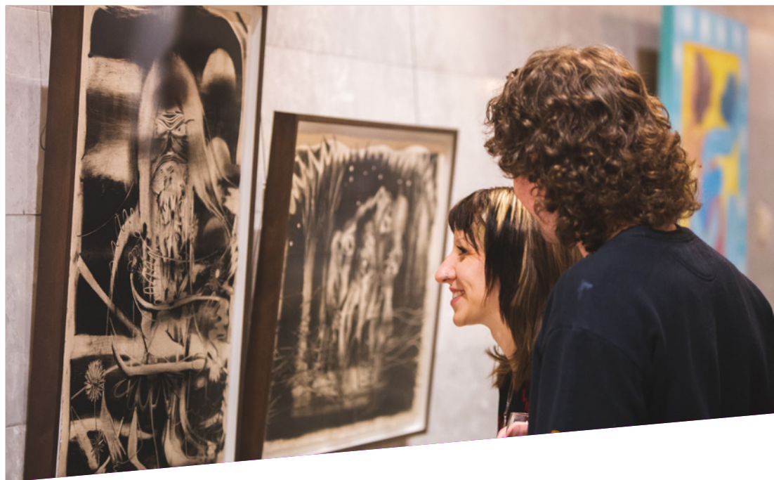
Vernissage de l'exposition Le corps n'en finit jamais de dire à la Maison du CAM

RÉSULTATS 2022-2025 Malgré un gel budgétaire reportant la cible de 25 M$ à 2026, la performance financière demeure solide. Les revenus des partenariats ont progressé, alors que les revenus de la Maison du Conseil ont doublé depuis 2021. Ces résultats témoignent de la capacité du Conseil à diversifier ses sources de revenus.