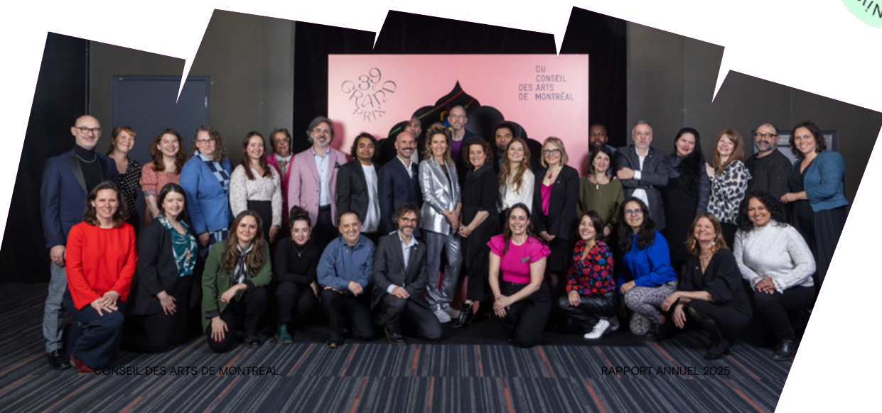
L'équipe du Conseil lors du 39 e Grand Prix