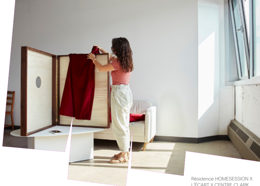
Résidence HOMESSESSION X L'ÉCART X CENTRE CLARK