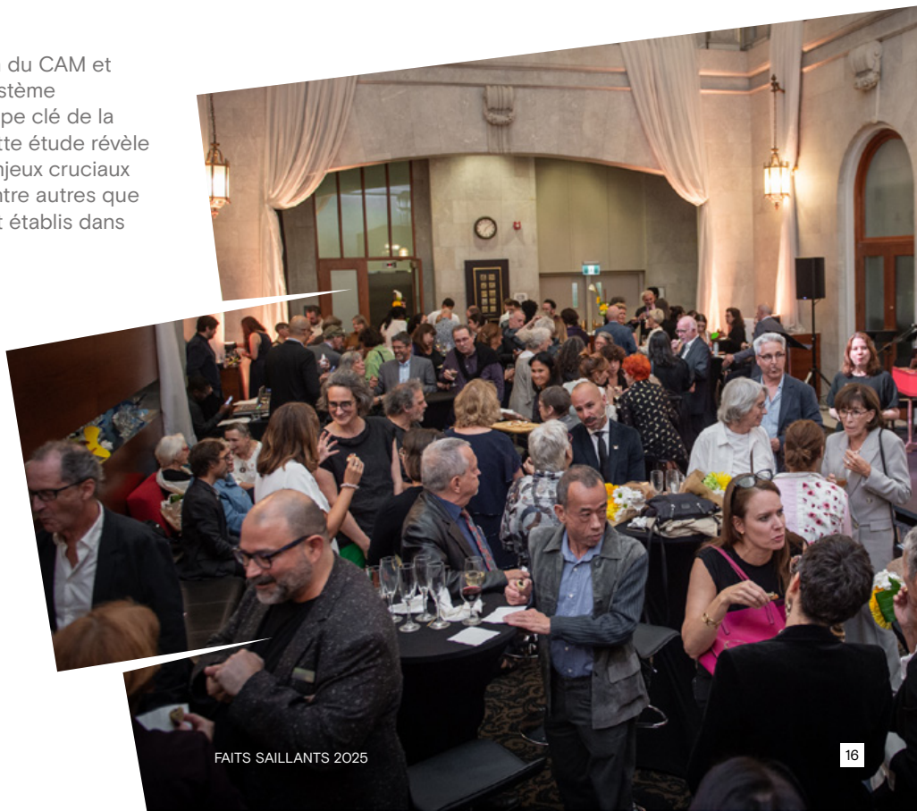
Première soirée Consécration

Derrière chaque artiste et organisme artistique se trouvent des professionnel·le·s dont l'engagement a façonné la vitalité artistique de Montréal. Dans une démarche de mémoire et de reconnaissance, le CAM exprime sa gratitude envers ces personnes qui ont laissé une empreinte durable sur le visage culturel de la métropole.