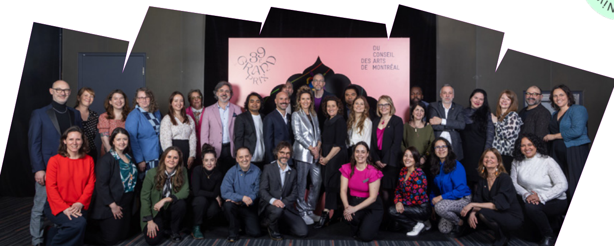
L'équipe du Conseil lors du 39 e Grand Prix